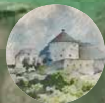
1 · Festung Kufstein