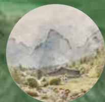
11 · Naturerlebnis Kaisergebirge