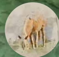
37 · Fohlenhof - Haflinger Erlebniswelt