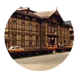
Bahnhof Kufstein* 1978