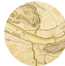
Kufstein, 18. Jhd.